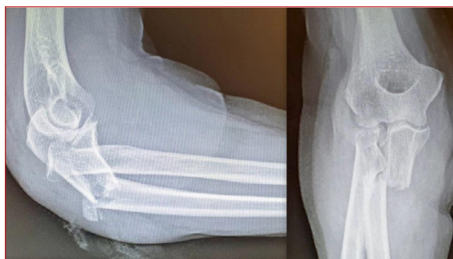
Figura 3. Radiografías lateral y AP de codo donde se demuestra una fractura luxación de Monteggia Bado II.