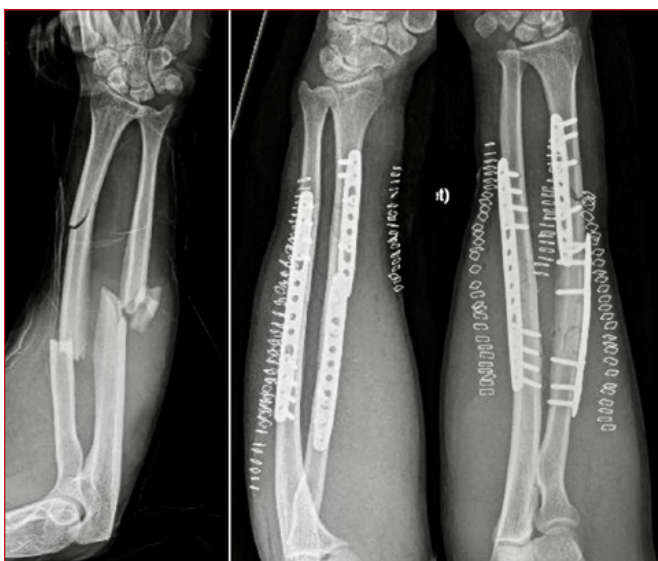
Figura 2. Radiografías pre y postquirúrgicas de fractura segmentaria de radio y conminuta de cúbito con utilización de placas LC-DCP a compresión.

su capacidad de crecimiento longitudinal, simplemente haciendo de tutor endomedular.