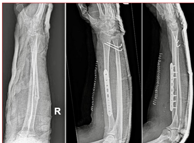
Figura 4. Radiografías pre y postquirúrgicas de fractura luxación de Galeazzi con placa a compresión y fijación de articulación radio cubital distal con 2 agujas de Kirschner.

Con respecto al tratamiento en adultos se opta por la reducción abierta y fijación interna con placa de compresión dinámica en el radio, lo que suele reducir la articulación radio cubital distal. Algunos autores defienden que es suficiente un yeso en supinación para mantener la articulación radio cubital distal reducida. Otros optan por una fijación provisional con aguja de