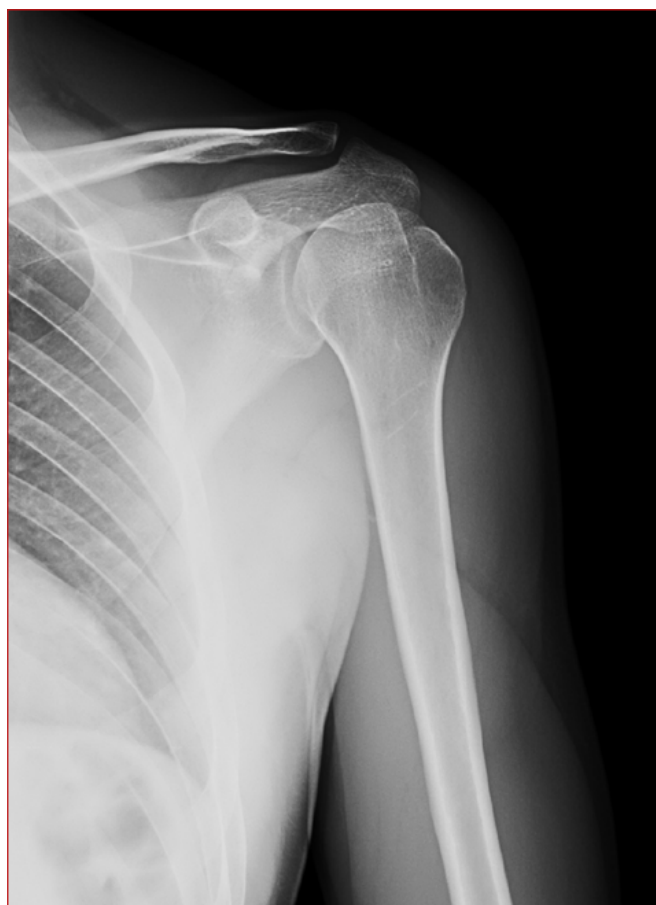
Figura 2. Rx AP Lesión de Hill-Sachs.