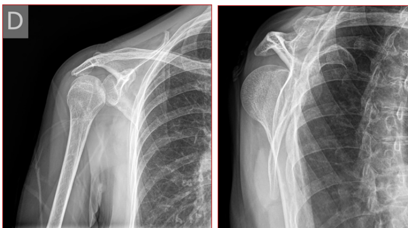
Figura 1. Izquierda: Rx AP imagen en bombilla. Derecha: Rx axial de luxación posterior.

Exploración física: maniobras específicas para evaluar laxitud y síntomas: