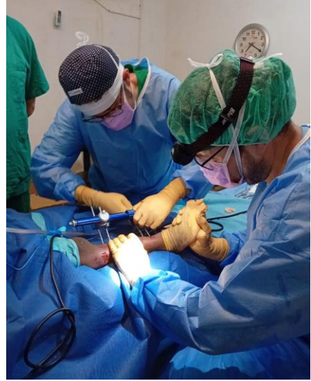
Equipo quirúrgico trabajando en la 1ª campaña de mayo 2024