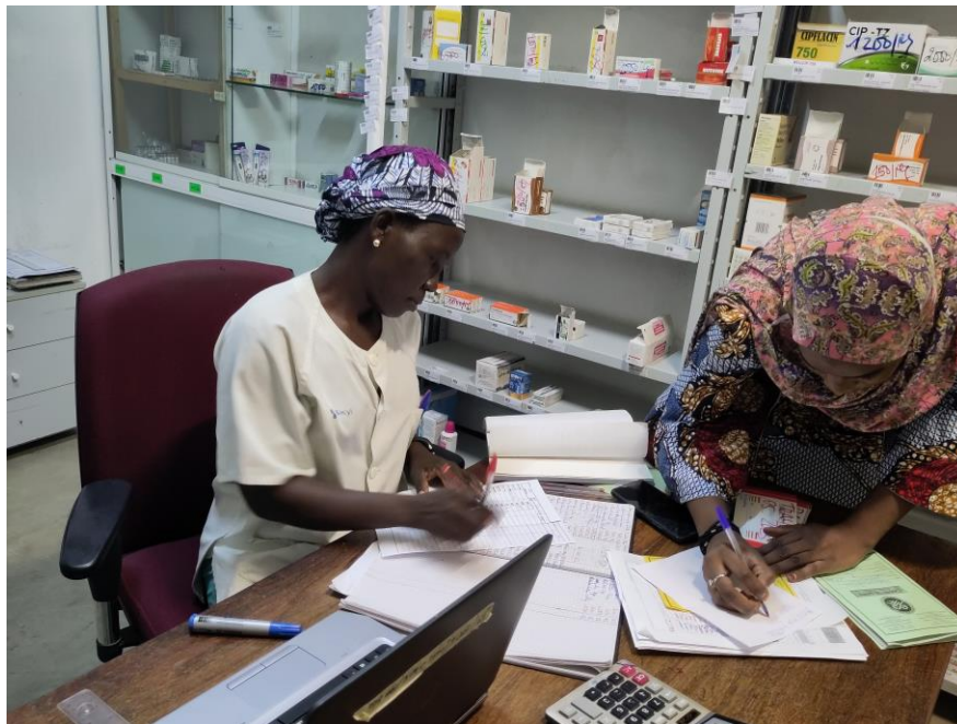
Farmacia del Hôpital Fondation Mayo Rey