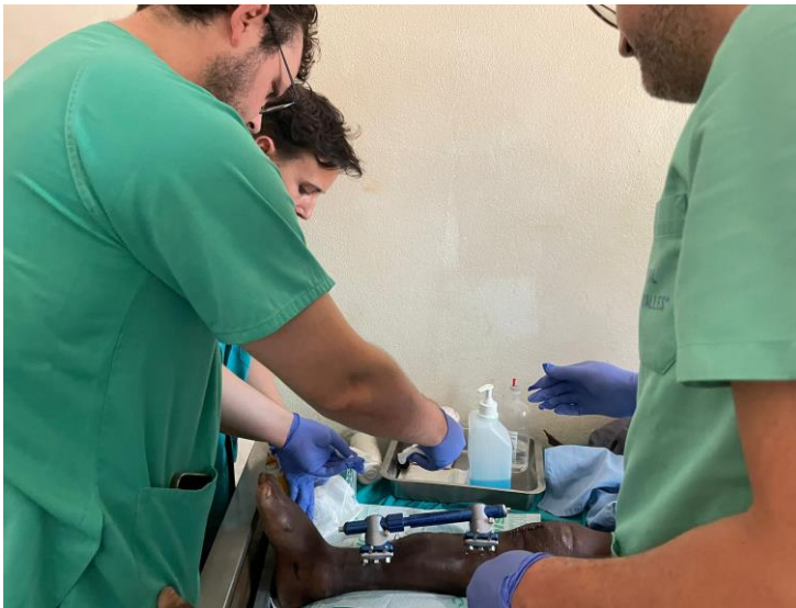
Realizando curas en la planta de hospitalización