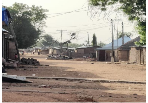
Barrios y calles de Rey Bouba (Camerún).