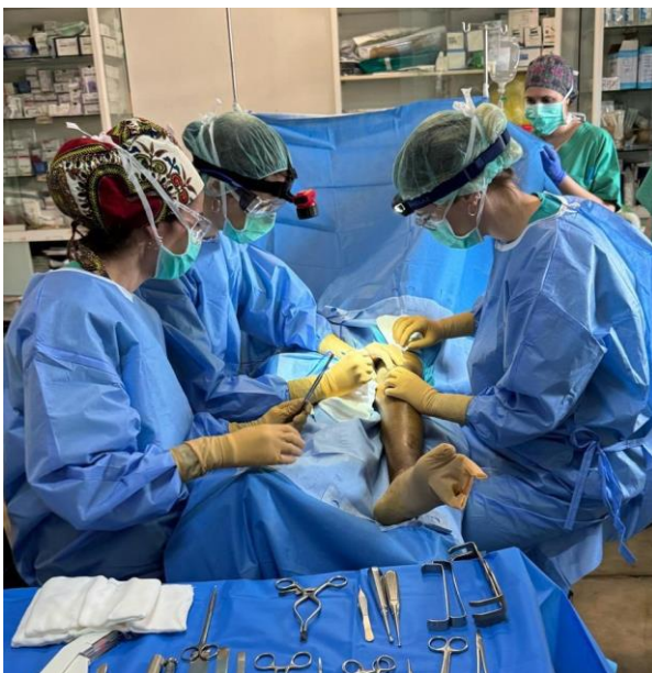
Equipo quirúrgico trabajando en la 2ª campaña de mayo 2024