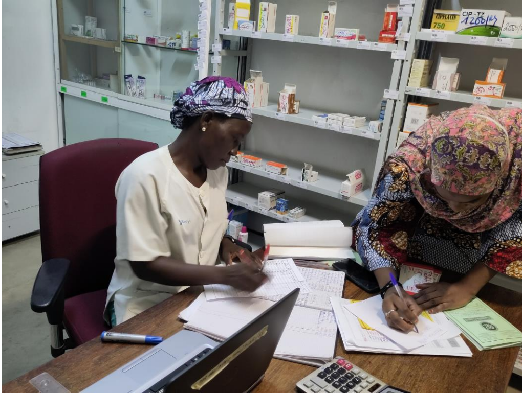
Farmacia del Hôpital Fondation Mayo Rey