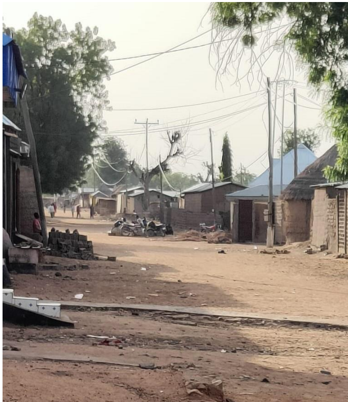
Barrios y calles de Rey Boubá (Camerún).