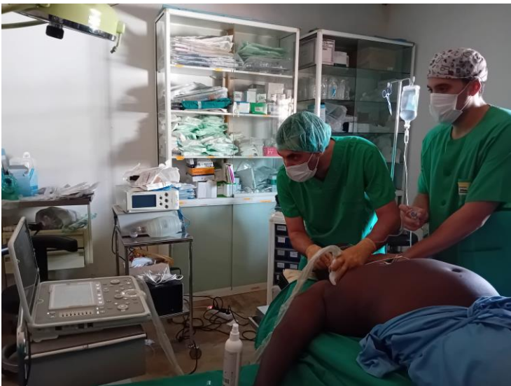
Equipo quirúrgico trabajando en la 1ª campaña de mayo 2024