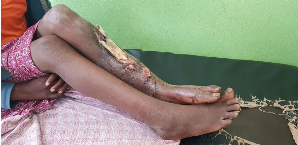
Fig. Osteomielitis tibia distal grado ....

Han sido preferentes desde el principio, la atención a los niños afectados de deformidades congénitas o adquiridas y a los que sufren infecciones osteoarticulares, muy frecuentes por sus condiciones de vida, así como la prestada a los antiguos enfermos de lepra que presentan graves secuelas y deformidades mediante la instauración y desarrollo de un programa de cirugía ortopédica reconstructiva específica para esta enfermedad.